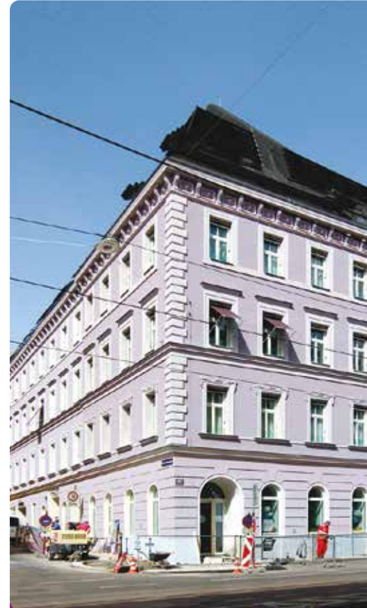
Sieger 2020 Kategorie „Wohnbau“: Mariahilferstraße 182 in Wien Mariahilferstraße 182, 1150 Wien Architektur: trimmel wall architekten zt gmbh Verarbeitung: Leyrer + Graf Baugesellschaft mbH © trimmel wall architekten zt gmbh

Die Qualitätsgruppe Wärmedämmsysteme ist eine Arbeitsgemeinschaft der größten Anbieter von Wärmedämmverbundsystemen (WDVS) in Österreich: Baumit, Capatect, Röfix und Sto. Ein Großteil aller in Österreich verarbeiteten WDVS kommt aus den Betrieben dieser Unternehmen. Ziel der ARGE QG WDS ist es, private und öffentliche Bauherren über die Vorzüge von Vollwärmeschutz zu informieren und die Verarbeitungsqualität zu steigern. Dafür gibt die QG eine Verarbeitungsrichtlinie (VAR) heraus und hat die Ausbildung zum zertifizierten WDVS-Fachverarbeiter (ZFV) initiiert. Der binneal ausgeschriebene ETHOUSE Award gilt als Zeichen, dass planerische und Ausführungsqualität zu attraktiven Objekten führen.