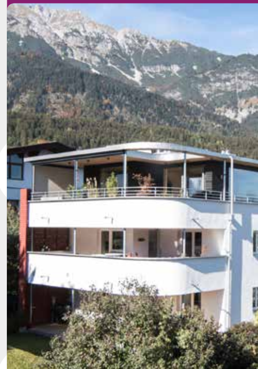
Sieger 2020 Kategorie „Privater Wohnbau“ 2-Familienhaus, Rum Friedhofsweg 22, 6063 Rum Architekturbüro U1architektur Verarbeitung: Mate & Darko OG © U1architektur